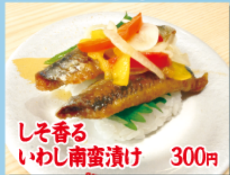
しそ香る いわし南蛮漬け 300円