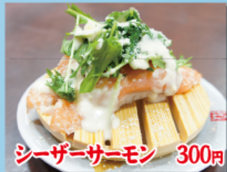
シーザーサーモン 300円