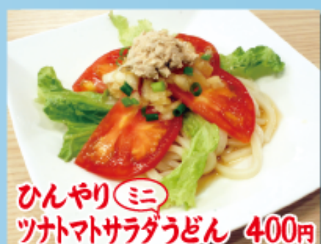
ひんやり(ミニ) ツナトマトサラダうどん 400円