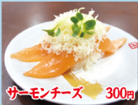
サーモンチーズ 300円