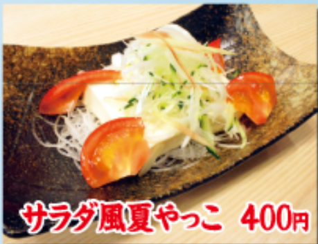
サラダ風夏やっこ 400円

旬の脂がのったイワシを唐揚げにし、自家製南蛮だれにつけました。しそがベストマッチ!! 夏に、食べて頂きたい。