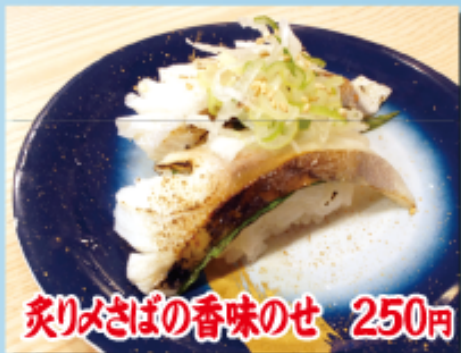
炙りみさばの香味のせ 250円