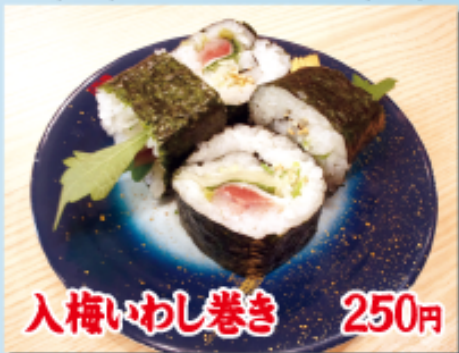
入梅いわし巻き 250円