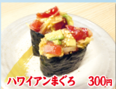
ハワイアンまぐろ 300円

シーザー好きにはたまらない一品。サラダ感覚でお子様から大人までお召し上がりください。