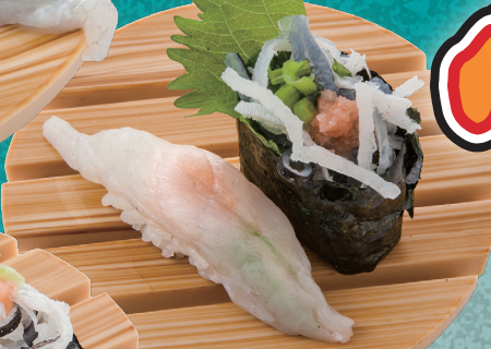
とらふぐ合盛り 400円