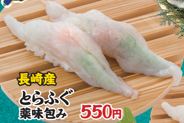
長崎産 とらふぐ 薬味包み 550円