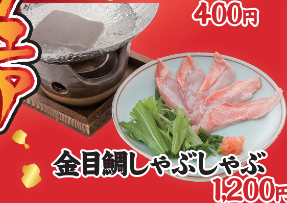
金目鯛しゃぶしゃぶ 1,200円