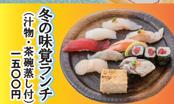
冬の味覚ランチ (汁物・茶碗蒸し付) 一五〇〇円