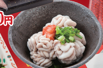
真鱈白子ぼん酢 550円