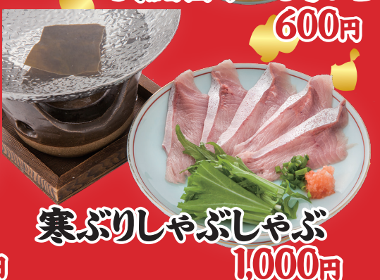
寒ぶりしゃぶしゃぶ 1,000円